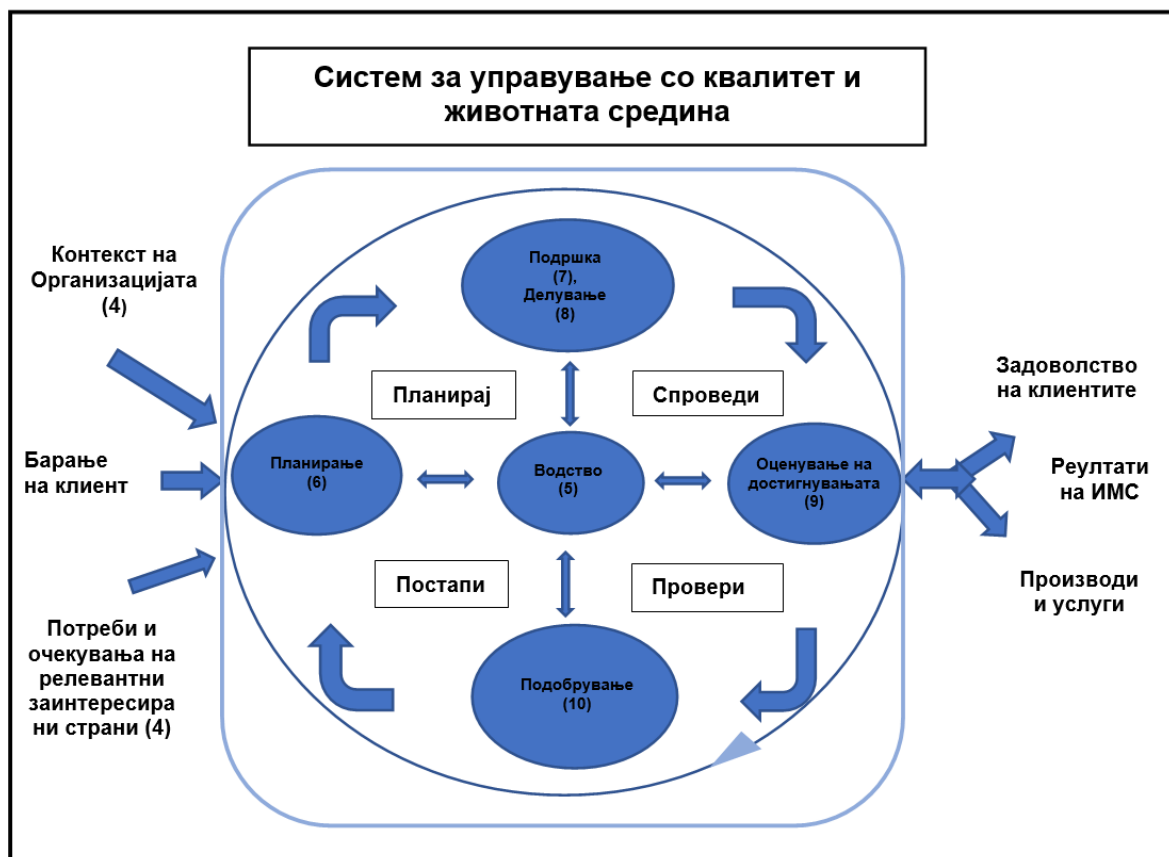
Систем за управување со квалитет и животната средина

Континуирано подобрување на дел од системот за управување со квалитет и заштита на животната средина е обезбедено со модел за управување со квалитетот на процесот како што е прикажано на сликата подолу.